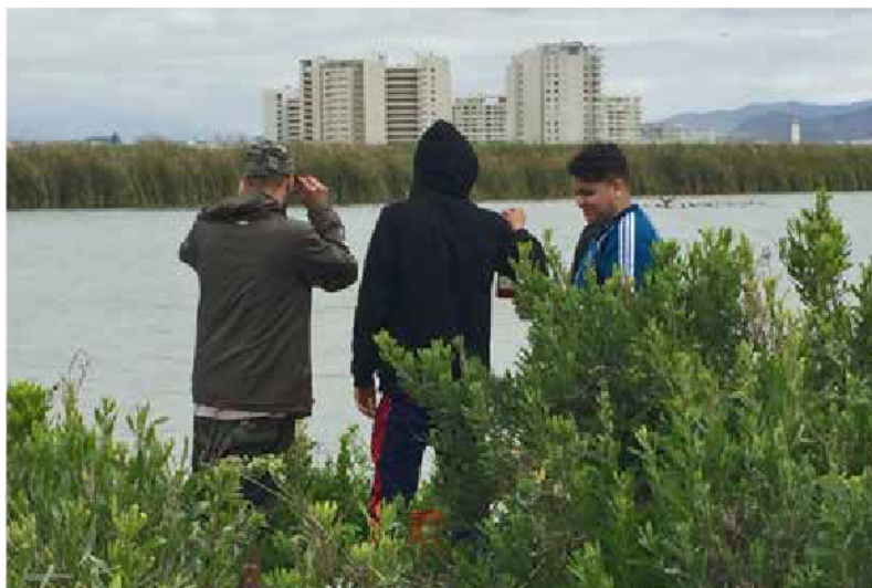
Humedal en la Comuna de Pichicuy, Región de Valparaíso.