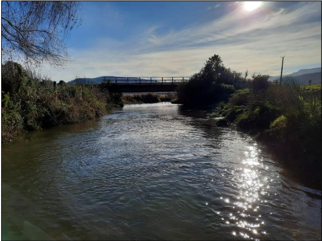
Figura 12. Estación Boroa Sur, mayo 2022.

En la estación Boroa Sur (Figura 12) la toma de la muestra fue con una red surber, ya que estábamos frente a un sistema lótico y con sustrato de arena-limo. En esta estación se colectaron cinco representantes de la familia Baetidae (Orden Ephemeroptera) (Figura 13) y dos individuos de la familia Tipulidae (Orden Díptera) (Figura 14). Además, se identificaron en terreno ejemplares de camarones de río en estado adulto y juvenil, y Aegla sp. (Figura 15), los cuales fueron liberados con posterioridad.