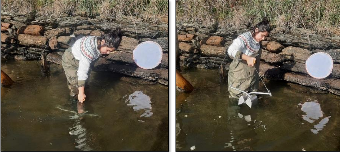
Figura 2. Extracción de macroinvertebrados de sustrato fangoso-sistema léntico, estación Caleta Queule, mayo 2022.