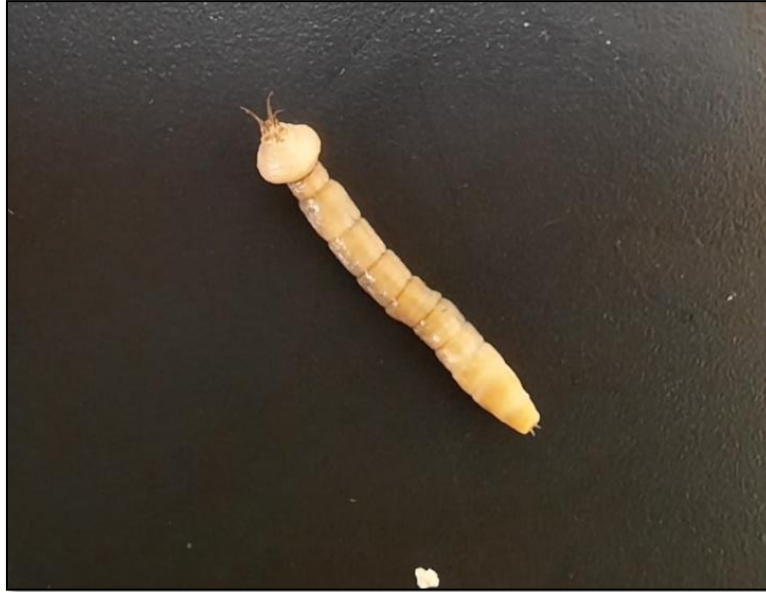
Figura 14. Larva de la familia Tipulidae presente en la estación Boroa Sur, mayo 2022

o terrestres (Domínguez & Fernández, 2009). De acuerdo con Figueroa et al., 2007 la familia Tipulidae presenta un valor de tolerancia a la contaminación de 3, en una escala de 1 a 10, donde 10 es el valor más alto, asociado a contaminación orgánica.