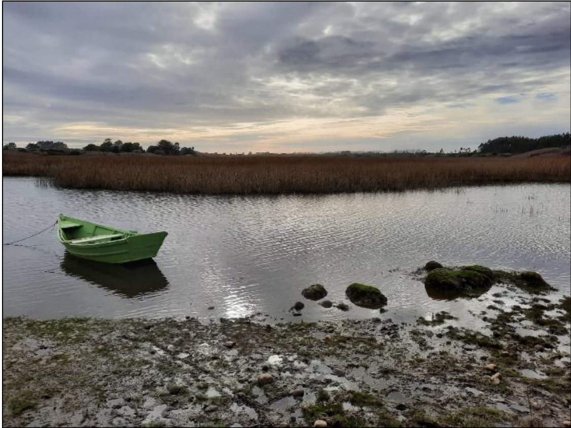
Figura 7. Estación de muestreo Laguna Patagua, mayo 2022.

En la estación Puerto Ramos solo hubo un individuo colectado, representante de la familia Clitellata, subclase Hirudínea (Figura 9). De acuerdo con Figueroa et al., 2007 la subclase Hirudínea presentan un valor de tolerancia a la contaminación de 10, en una escala de 1 a 10, donde 10 es el valor más alto asociado a contaminación orgánica.