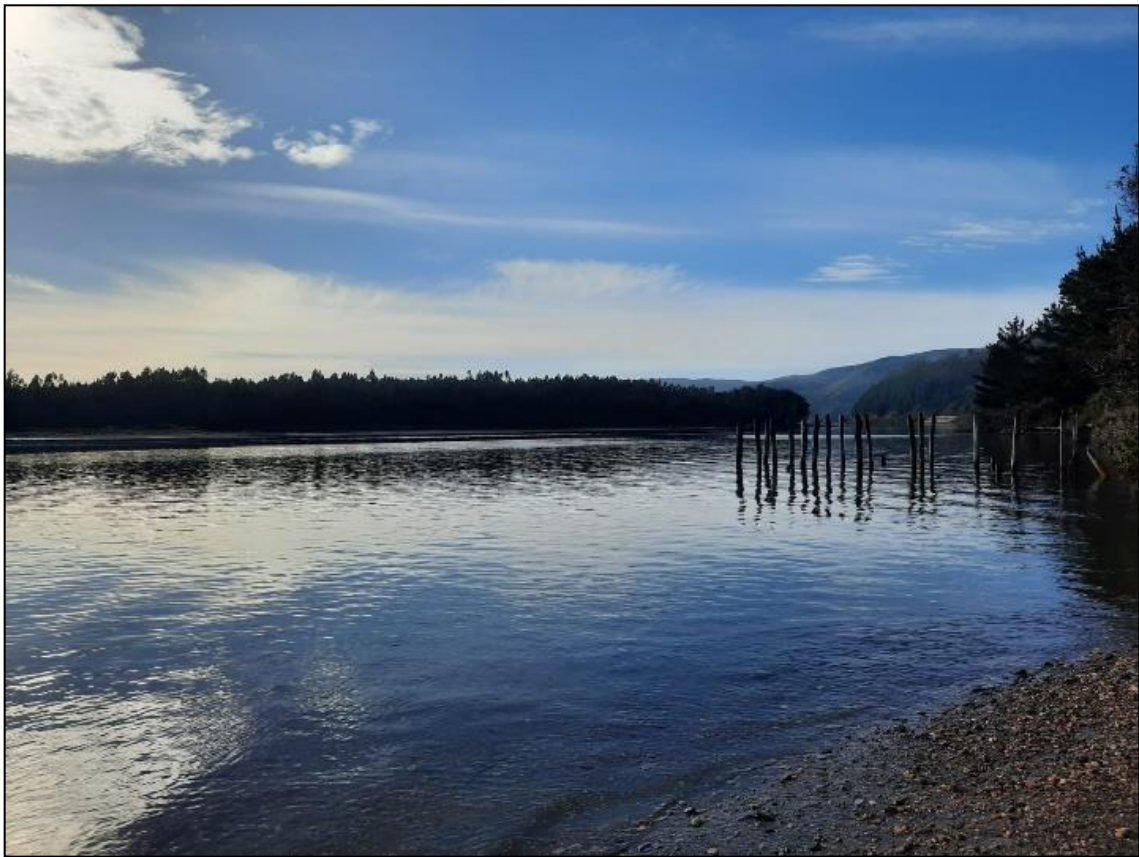
Figura 4. Estación de muestreo Caleta Queule, mayo 2022.

En la estación Caleta Queule (Figura 4) se registraron 28 individuos colectados de los cuales 20 pertenecían a la familia Corophiidae y ocho al phylum Annelida, clase Polychaeta (Figura 5).