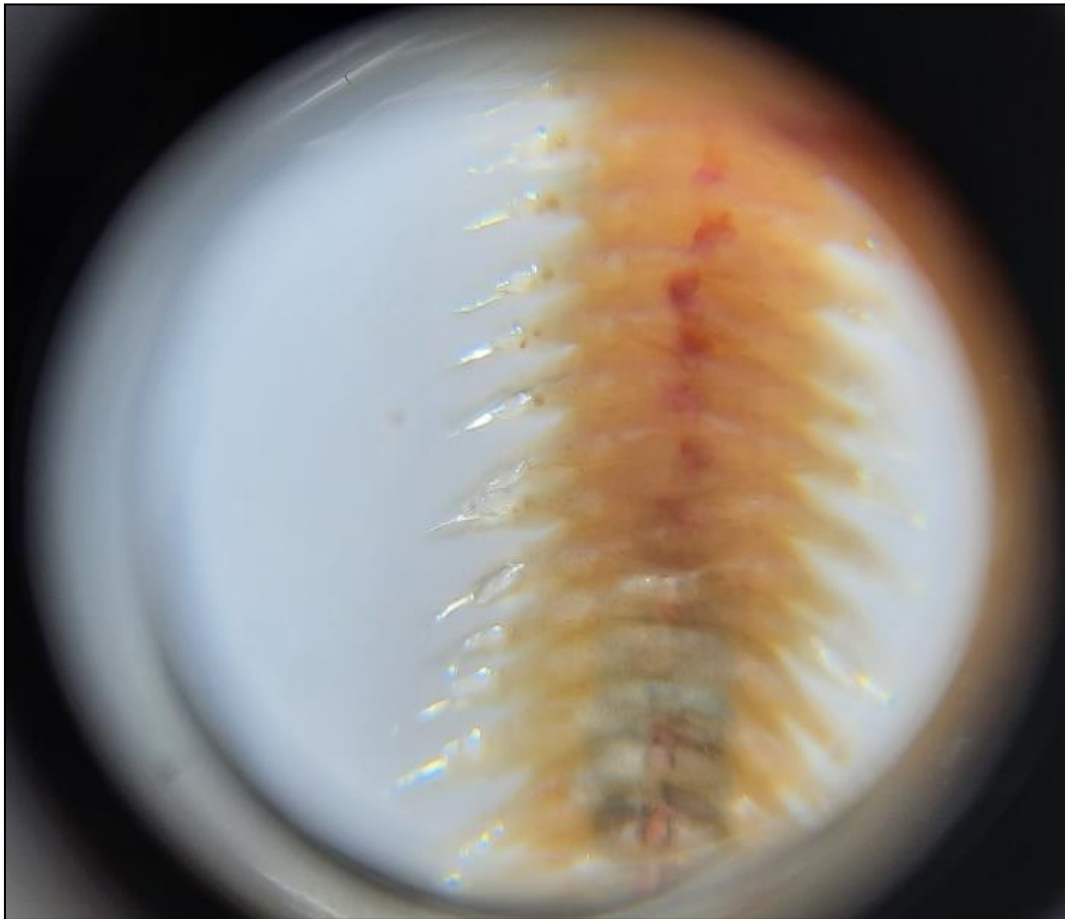
Figura 5. Individuo de la clase Polychaeta, presente en la estación Caleta Queule, mayo 2022.

Los poliquetos se caracterizan por poseer en cada segmento un par de parapodios, portando numerosas quetas, estos parapodios los utilizan principalmente para locomoción. Se ha observado frecuentemente que los poliquetos de las familias Capitellidae, Spionidae y Cirratulidae están presentes en sectores con distintos grados de contaminación orgánica producto de las descargas domésticas (Méndez, 2002). En la estación Caleta Queule existe un ducto de descarga de aguas residuales, en el momento de la muestra se pudo visibilizar restos de espumas y sustancias detergentes, además de restos de materia orgánica probablemente materia fecal.