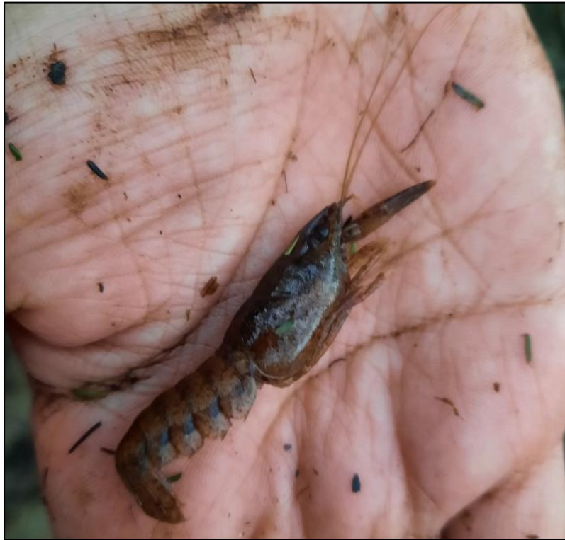
Figura 10. Individuo Parastacus nicoleti presente en la estación Puerto Ramos, mayo 2022.

Además, se identificaron en terreno individuos de camarón de río en estado juvenil y adulto, representantes de la familia parastacidae, especie Parastacus nicoleti (Figura 10) e individuos del género Chilina sp., los cuales fueron identificados y devueltos a su hábitats. De acuerdo con Figueroa et al., 2007 la familia Parastacidae presentan un valor de tolerancia a la contaminación de 6, en una escala de 1 a 10, donde 10 es el valor más alto asociado a contaminación orgánica.