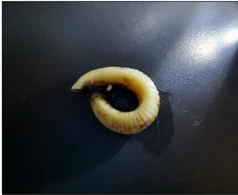
Figura 9. Individuo de la subclase Hirudínea, presente en la estación Puerto Ramos, mayo 2022.