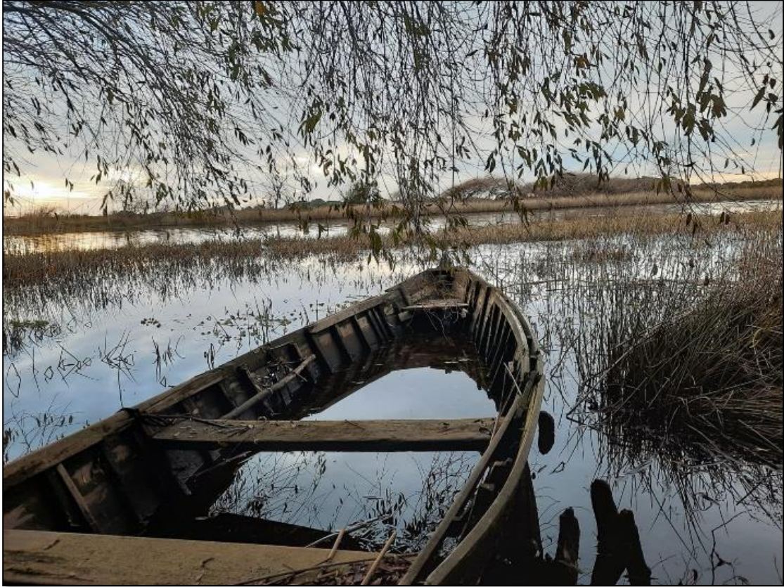
Figura 8. Estación Puerto Ramos, mayo 2022.