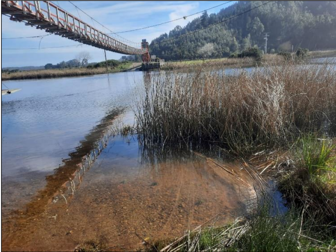
Figura 6. Estación de muestreo Balsa-Nigüe, mayo 2022.

En la estación Laguna Patagua (Figura 7) se registraron ocho individuos colectados, los ocho representantes eran del phylum Annelida, clase Clitellata, subclase Oligochaeta. En el momento de la toma de la muestra se pudo observar huellas de animales a la orilla de la laguna (perro y caballo) y restos de materia fecal de origen animal. De acuerdo con Figueroa et al., 2007 los Oligochaetas presentan un valor de tolerancia a la contaminación de 8, en una escala de 1 a 10, donde 10 es el valor más alto asociado a contaminación orgánica. El hecho de que los oligoquetos sean el grupo taxonómico dominante en esta estación podría atribuirse a contaminantes y nutrientes derivados de la actividad agrícola y de vertidos de efluentes residuales en el ecosistema acuático (Martínez-Bastida et al., 2006).