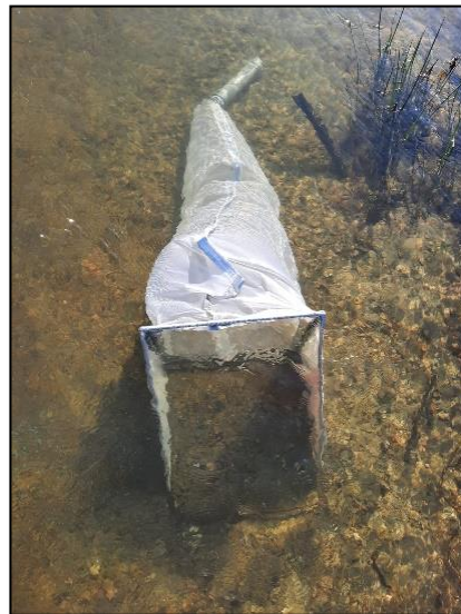
Figura 3. Extracción de macroinvertebrados con red surber, mayo 2022.

La colecta se hizo por medio de una red surber de 30 cm x 30 cm, con una apertura de malla de 500 \mu\text{m} aproximadamente, la cual fue situada en contra de la corriente en el cuerpo de agua por alrededor de 5 minutos (Figura 3). Los organismos capturados fueron fijados en etanol al 90% y almacenados en frascos plásticos para su posterior análisis. La identificación se hizo utilizando una lupa estereoscópica, con claves taxonómicas de Domínguez & Fernández (2009), identificando a nivel de familia y en algunos casos a nivel clase o subclase.