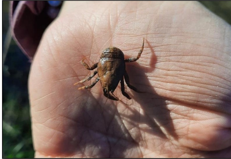
Figura 15. Ejemplar de la familia Aeglidae en la estación Boroa Sur, mayo 2022

En la estación Boroa solo se registró un individuo, perteneciente a la familia Hyallellidae (clase Malacostraca, orden Amphipoda) (Tabla 2). Los anfípodos tiene un rol clave como descomponedores de la materia orgánica, y como presas para aves, peces y macroinvertebrados como insectos acuáticos (Jara et al., 2006). Hyalella sp. constituye una fracción significativa de la biomasa animal. Aunque su tasa de renovación no sea muy alta (Wetzel, 1981), facilitan el flujo de energía por la transformación de la energía de epífitas y detritos en material orgánico particulado y biomasa para micro y macro nutrientes (Wen, 1992). De acuerdo con Figueroa et al., 2007 la familia Hyallellidae presenta un valor de tolerancia a la contaminación de 8 en una escala de 1 a 10, donde 10 es el valor más alto, asociado a contaminación orgánica.