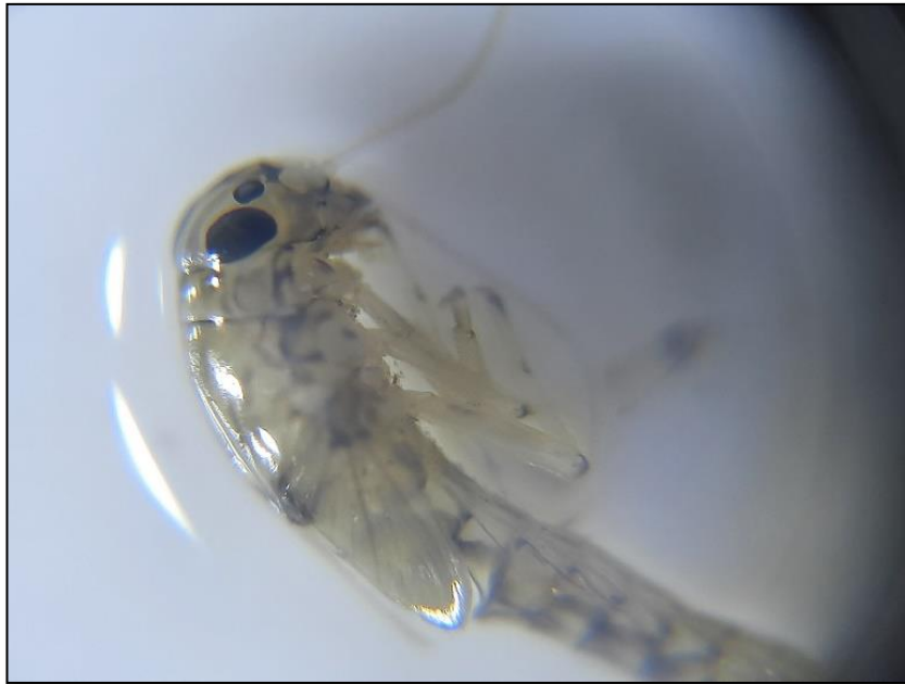
Figura 13. Ninfa de la familia Baetidae (Orden Ephemeroptera) presente en la estación Boroa Sur, mayo 2022.

son abundantes en la mayoría de las quebradas y ríos no contaminados. Algunas especies del género Baetodes y Camelobaetidius están dentro de los efímeros que pueden tolerar cierto grado de contaminación y alteración de su hábitat, llegando a ser muy abundantes localmente (Flowers & de la Rosa, 2010), Baetodes no se encuentra en registros de Ephemeropteros para Chile y Camelobaetidiu con registro solo en la región del Ñuble (Román de la Fuente, 2022). De acuerdo con Figueroa et al., 2007 la familia Baetidae presenta un valor de tolerancia a la contaminación de 4, en una escala de 1 a 10, donde 10 es el valor más alto, asociado a contaminación orgánica.